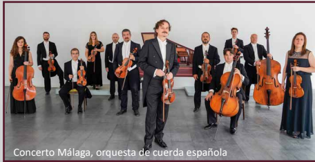
Concerto Málaga, orquesta de cuerda española

Orquesta de cuerdas española de contrastada calidad internacional, fundada en 1996 por un grupo de jóvenes músicos andaluces que retoman el espíritu musical legado por los compositores pertenecientes a la Generación del 98 en pro de la protección y divulgación de la música docta occidental de raíz e inspiración hispana. Aclamado por sus interpretaciones de música española e integrado por artistas europeos dedicados a la investigación, estudio e interpretación del repertorio para cuerdas que abarca desde finales del siglo XVII hasta nuestros días, Concerto Málaga es según la revista especializada alemana Ensemble Magazine «uno de los mejores conjuntos españoles» y según la radio americana WFMT Chicago Classical, «uno de los conjuntos más importantes de España». En palabras del célebre guitarrista Pepe Romero, «Concerto Málaga le dará a Málaga lo que I Musici le ha dado a Italia».